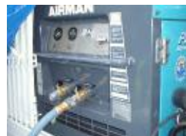
圧縮空気を送るコンプレッサー