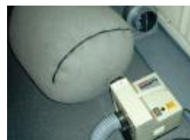
粉塵などを吸引する大型集塵機

換気ダクトはくねくねと何度も曲がって建物の外部へと到達します。直径およそ10~15cmの折れ曲がった筒の中を清掃するには、特殊な技術が必要です。弊社の提案システムは住宅用の複雑に曲がったあらゆるダクト形状に対応し、内部の汚れをすみずみまできれいにします。