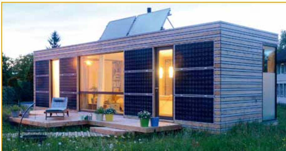
すのこファサードのモバイル・エコ・パッシブハウス