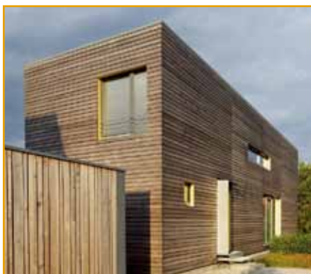
パッシブハウスの住宅