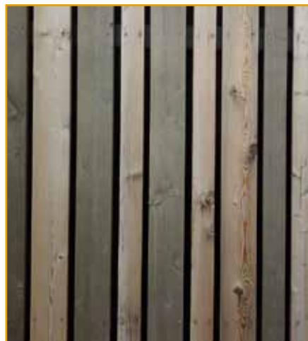
パッシブハウスの幼稚園/すのこファサード