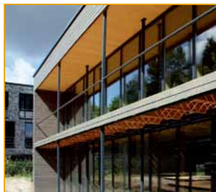
パッシブオフィス