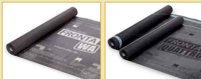
ソリテックス フロンタWA

テスコINVISテープで仕上げるシートの重ね合わせ 床との接着にはオルコン接着剤を使用 角のある箇所便利なテスコプロファイルテープ カーフレックスを使った配線箇所の気密施工